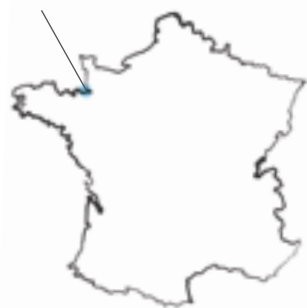
Baie du Mont-Saint-Michel

Jérôme Houyvet ne pouvait évidemment pas passer à côté de ce sublime spectacle, mais pour le photographe, le Mont-Saint-Michel ne serait pas ce qu'il est sans cette grande baie qui l'entoure. Vue du ciel, elle délivre des tableaux d'une beauté époustouflante : Chausey et ses lagons turquoise, Avranches et ses brumes matinales, Granville et la valse de ses voiliers, les herbues et le graphisme des polders de la baie, Cancale et les premières côtes escarpées de Bretagne, Saint-Malo et ses remparts rompus aux assauts de la mer... Autant de sources d'inspiration et d'invitations au voyage pour ce photographe volant, libre comme l'air à bord de son paramoteur, qui nous offre dans ce beau livre cette vision aérienne inédite du nouveau visage de la « Grande baie » du Mont-Saint-Michel.