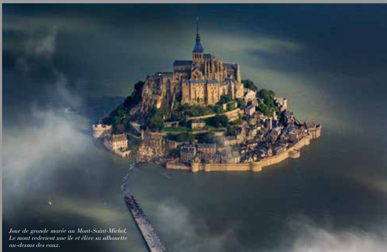
Jour de grande marée au Mont-Saint-Michel. Le mont redevient une île et élève sa silhouette au-dessus des eaux.