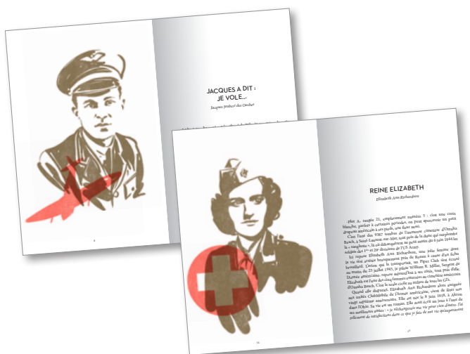
LES PHOTOS DU LIVRE

Vous souhaitez présenter l'ouvrage dans vos colonnes, à votre antenne, sur votre site web, sur votre blog ?